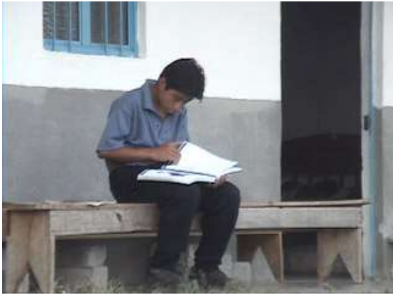
...studiando per la capacitacion...