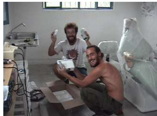
...dos niños felizes...