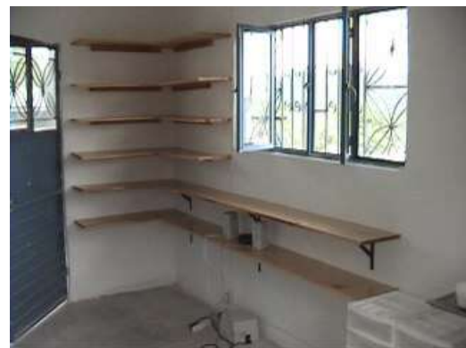
...ripiani per il materiale...