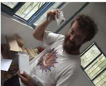
...alce e il radiologico...