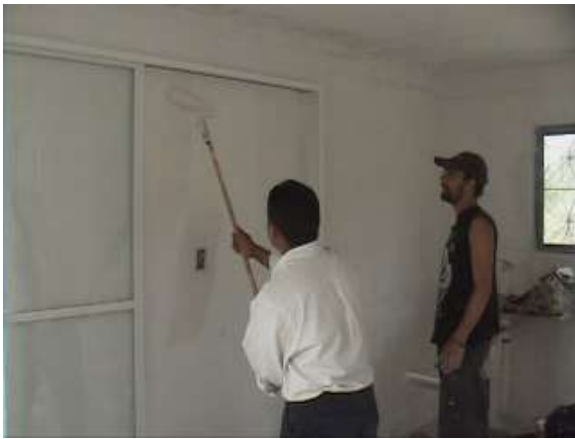
...pintando meccanica dental...