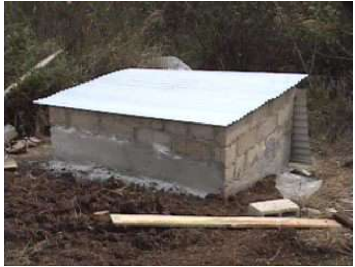
...casetta compressore e generatore...