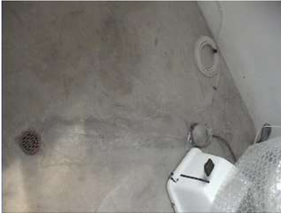
...scarichi del riunito...