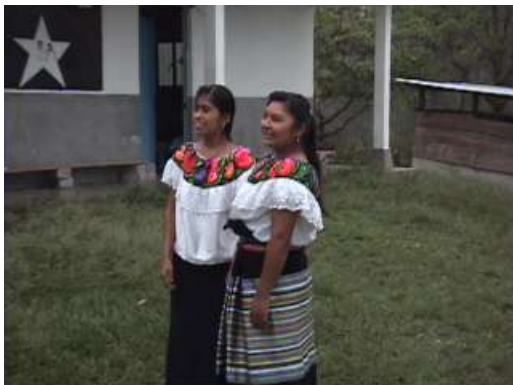
...due belle promotore...