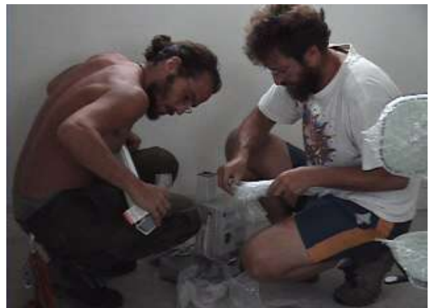
...montando il radiologico...