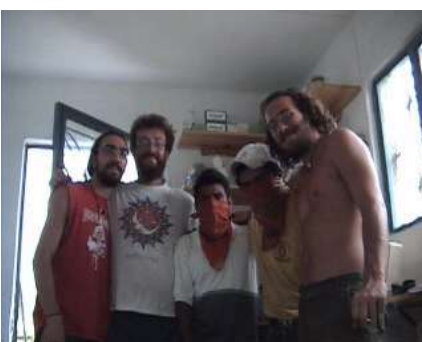
...los sin rostro...