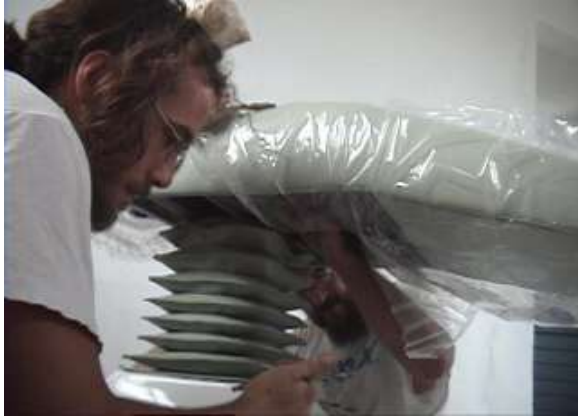
...andre il sellon e alce...