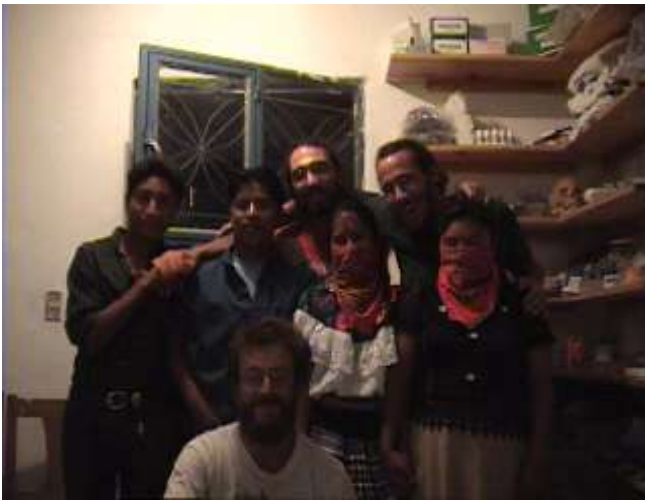
...las sin rostro...