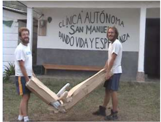
...l'entusiasmo... era l'ora...