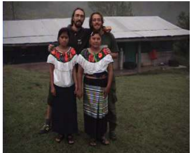
...con dietro la cucina...