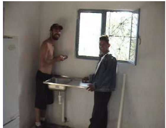
...lavabo del laboratorio odontotecnico...