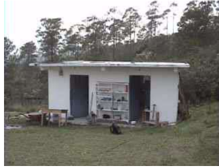
...lavori in corso...