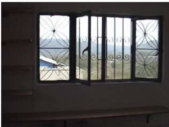
...la vista da dentro...