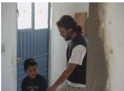
...attraverso il muro...