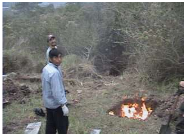
...un po' di riciclaggio...