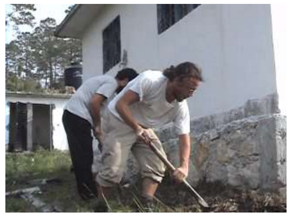
...i buchi per l'aria e l'acqua...